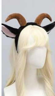
Lamb ear hairband