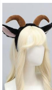
Lamb ear hairband