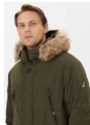
Parka para escena 2